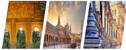
Hotel 4* in tour o similare